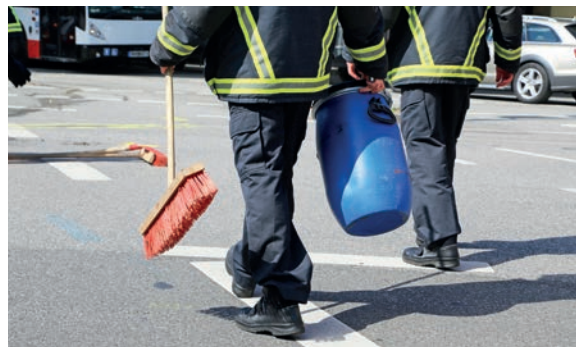
Mit ÖlBond ist schnell und sicher der Boden wieder sauber.